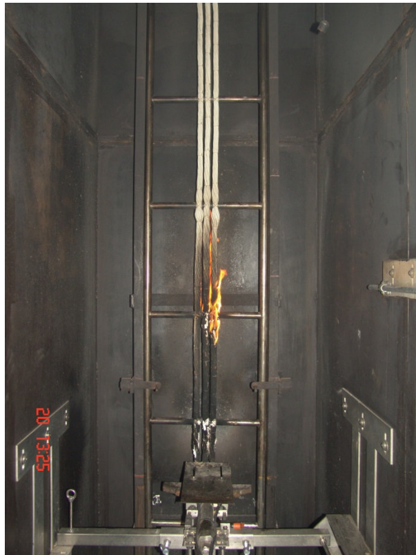
Bild 5: nach Abschalten des Brenners Figure 5: after extinguishment of the burner